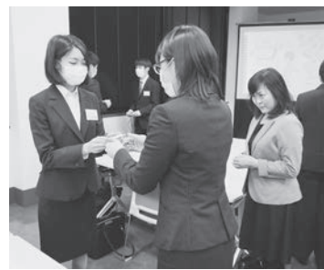
名刺交換の実践トレーニング

にやってみると非常に難しかった。事前に体験できてよかった」「改めて社会人としての自覚を強く持つことができた」「自分に不足している部分を痛感させられた」などの感想が寄せられた。