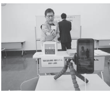
抽選会をライブ配信

3月26日(木)には問屋町会館にて抽選会を開催。今回は新型コロナウイルス感染症拡大を受けて、感染予防として参加者を集めずに実施し、そ