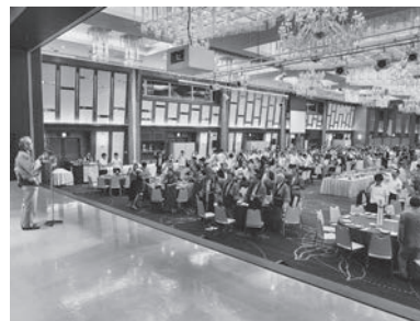
昨年度の納涼パーティー

第28回問屋町納涼パーティー ①日時 7月17日（金）19時～21時 ②会場 ホテル青森