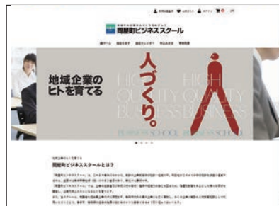
リニューアルされたホームページ

問屋町ビジネススクールは2011年に開校し、これまで延べ4,800名以上が受講するなど、地域密着型の人材教育で地元企業を中心とした社員のスキルアップや組織の強化等に寄与している。リニューアルでは、デザインに加え受講者管理システムも一新し、より管理しやすく省力化も図られた。近年はスマートフォンでのWebサイ