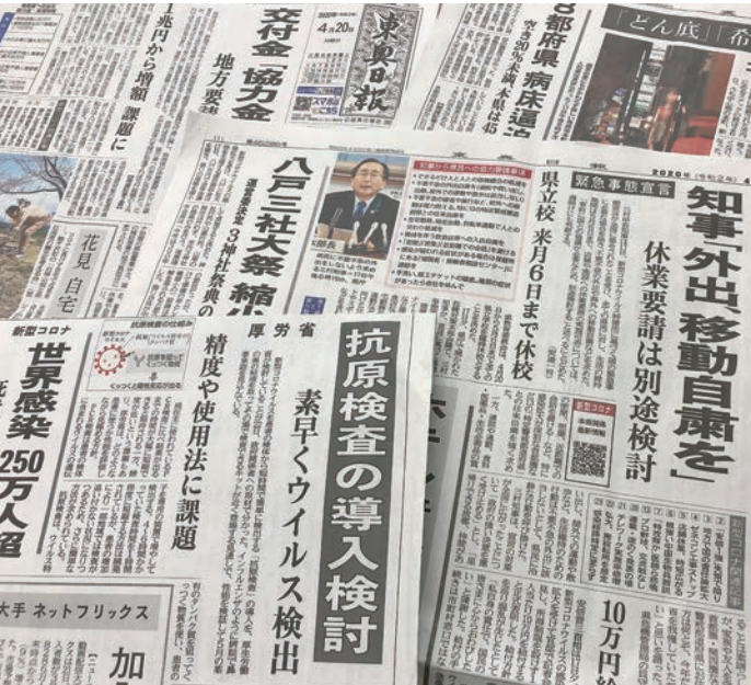
新型コロナウイルスを報じる地元紙

編集・発行 協同組合青森総合卸センター 〒030-0131 青森市問屋町2丁目17-3 ☎017-738-4711 FAX017-738-7323 URL http://www.tonyamachi.com E-mail info@tonyamachi.com 発行/2020年4月30日