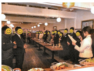
問屋町婚活パーティー