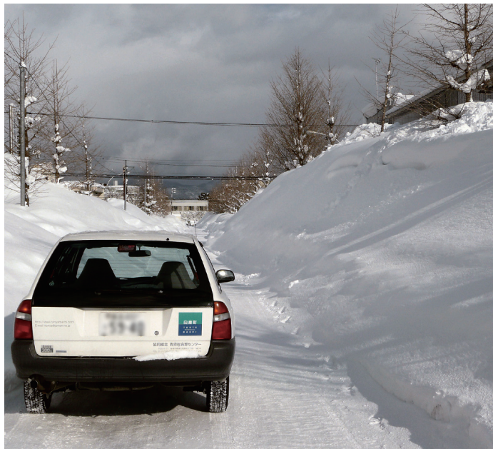
道路脇にうず高く積まれた雪で道路幅員減少

編集・発行 協同組合青森総合卸センター 〒030-0131 青森市問屋町2丁目17-3 ☎017-738-4711 FAX017-738-7323 URL http://www.tonyamachi.com E-mail info@tonyamachi.com 発行/平成25年3月29日