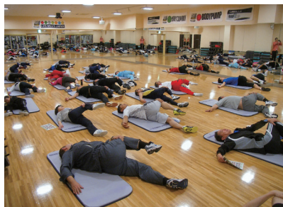
参加者全員でストレッチ

カウンタリング終了後には、インストラクター指導のもと、「自宅でも簡単にできるストレッチ運動」を参加者全員で実施。その後2グループに別れ、スタジオトレーニングやマシントレーニングで気持ちのよい汗を流した。