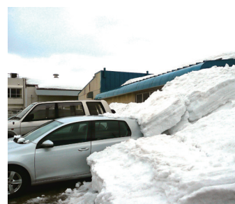
屋根雪が駐車車両に直撃