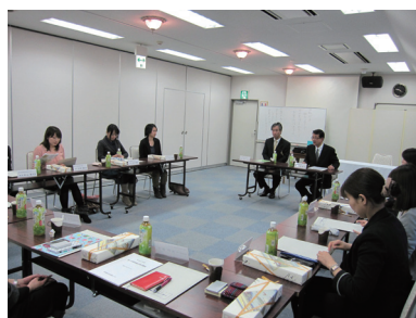
事務局職員研修会