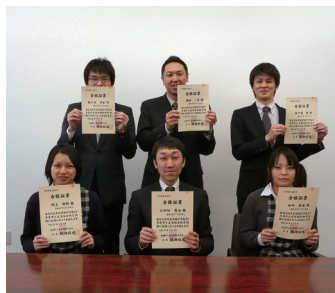
合格証書を手にし喜ぶ合格者

運営の3科目。全国で410名が受験し、全科目合格者が187名、合格率は45.6%であった。都道府県別の合格者数では、青森県全体で12名が合格し、東京、大阪に次いで全国3位の好成績を記録した。組合では、組合員企業発展に寄与すべく、事務局全職員の合格を目指す。