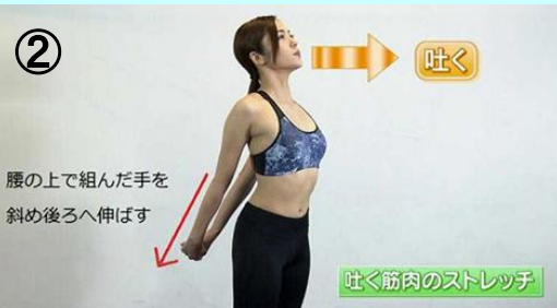
吐く筋肉のストレッチ