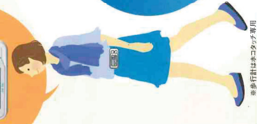
※ 歩行計はホコタッチ専用