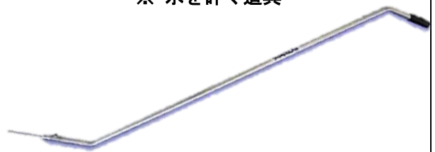
アイスピッケル ※ 氷を砕く道具