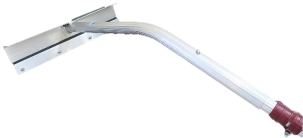
雪庇落とし(ブレードタイプ)