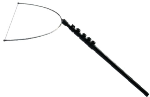
雪庇落とし(ワイヤータイプ)